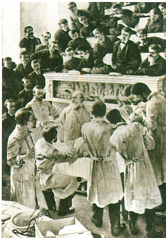
A.F.Seligman: Dr.T.Billroth při výuce ve Vídeňské ústřední nemocnici (1880)

ČESKÁ LÉKAŘSKÁ SPOLEČNOST J. E. PURKYNĚ SPOLEK LÉKAŘŮ V NOVÉM MĚSTĚ NA MORAVĚ