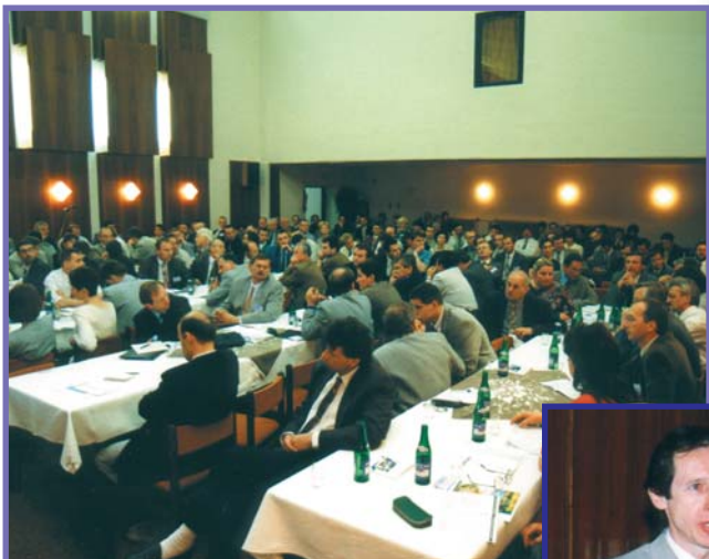
záběry ze setkání v r. 1999